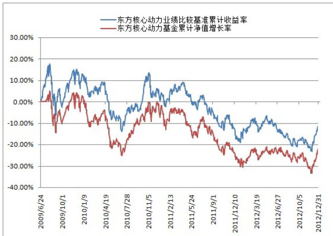
东方核心动力股票型开放式证券投资基金 份额累计净值增长率与业绩比较基准收益率历史走势对比图 (2009 年 6 月 24 日至 2012 年 12 月 31 日)