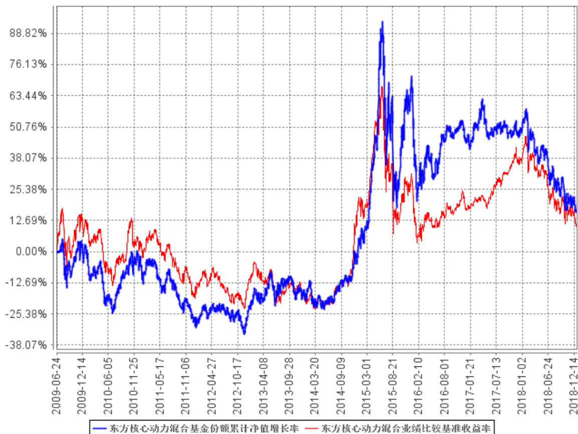
东方核心动力混合基金份额累计净值增长率与同期业绩比较基准收益率的历史走势对比图