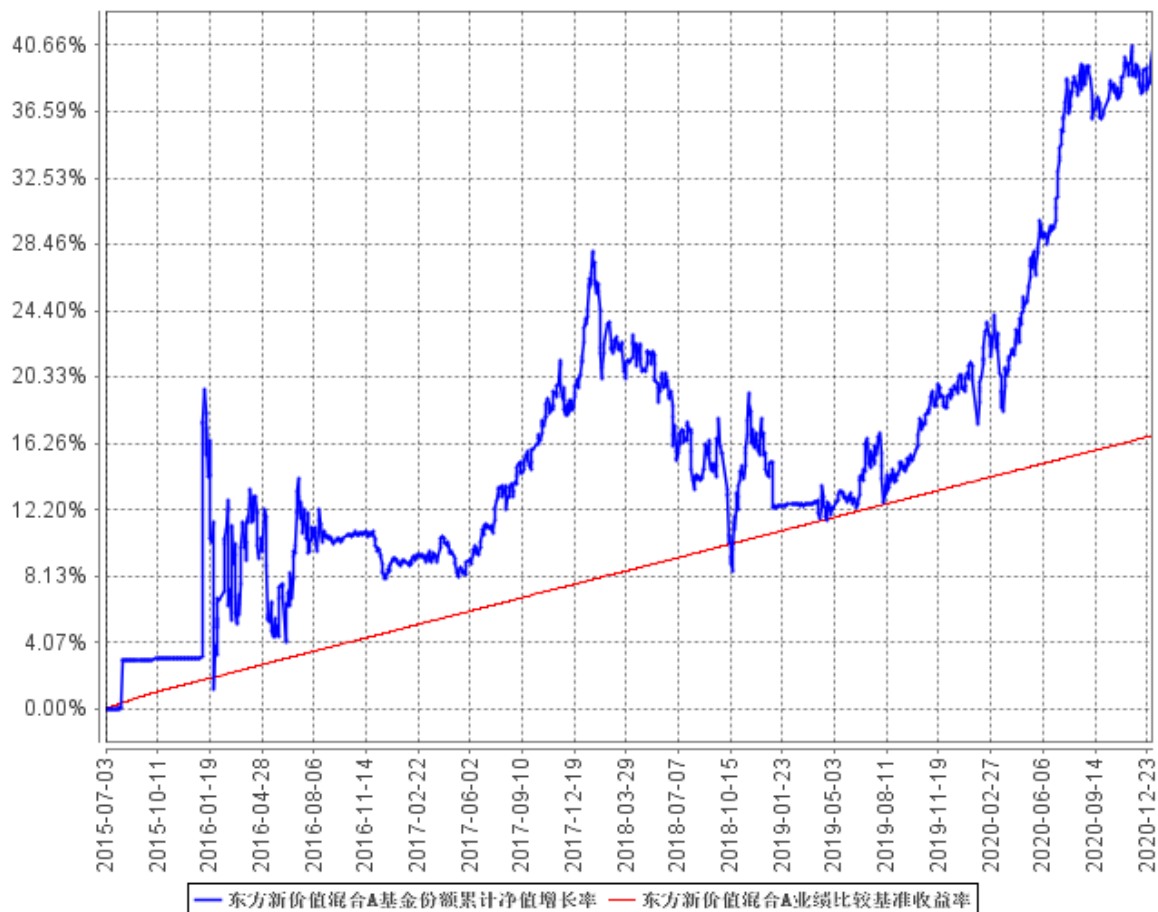
东方新价值混合A基金份额累计净值增长率与同期业绩比较基准收益率的历史走势对比图