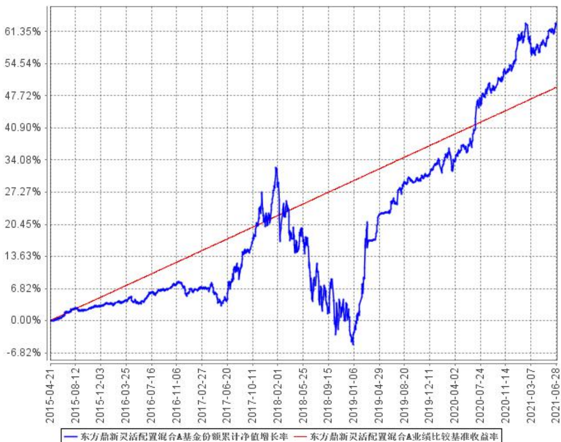
东方鼎新灵活配置混合A基金份额累计净值增长率与同期业绩比较基准收益率的历史走势对比图