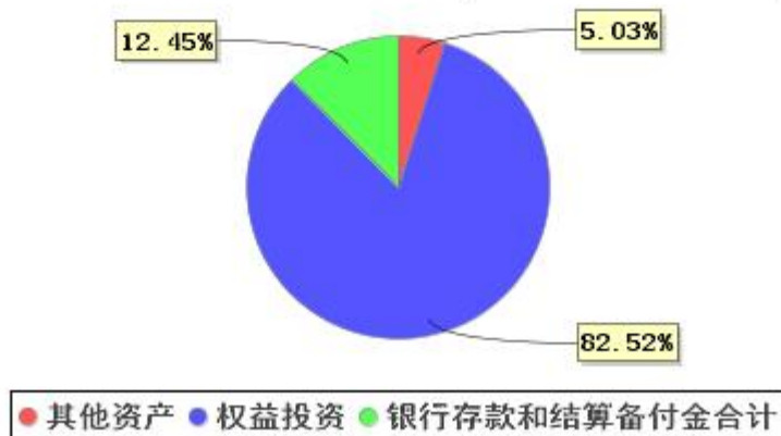
投资组合资产配置图表(2021年6月30日)