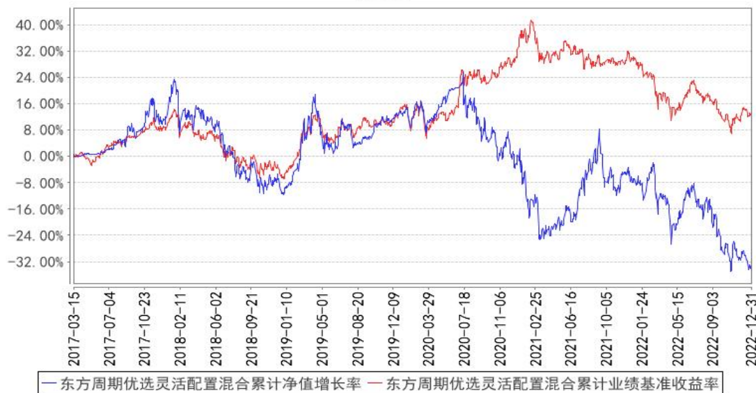
东方周期优选灵活配置混合累计净值增长率与同期业绩比较基准收益率的历史走势图