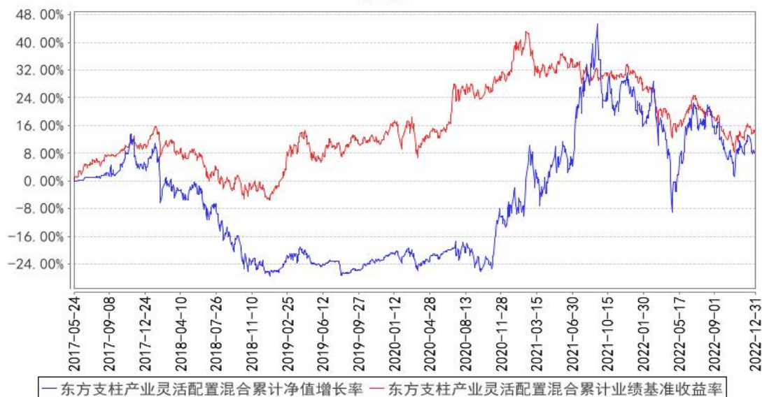
东方支柱产业灵活配置混合累计净值增长率与同期业绩比较基准收益率的历史走势对比图