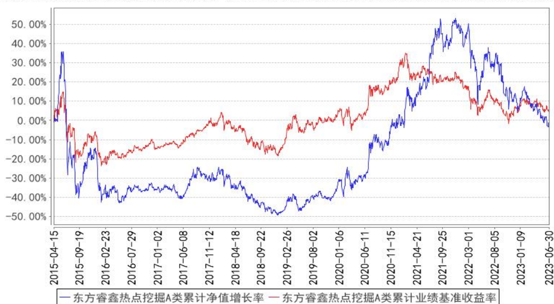
东方睿鑫热点挖掘A类累计净值增长率与同期业绩比较基准收益率的历史走势对比图