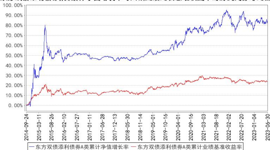
东方双债添利债券A类累计净值增长率与同期业绩比较基准收益率的历史走势对比图