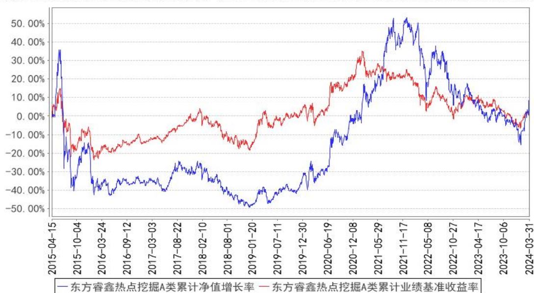
东方睿鑫热点挖掘A类累计净值增长率与同期业绩比较基准收益率的历史走势对比图