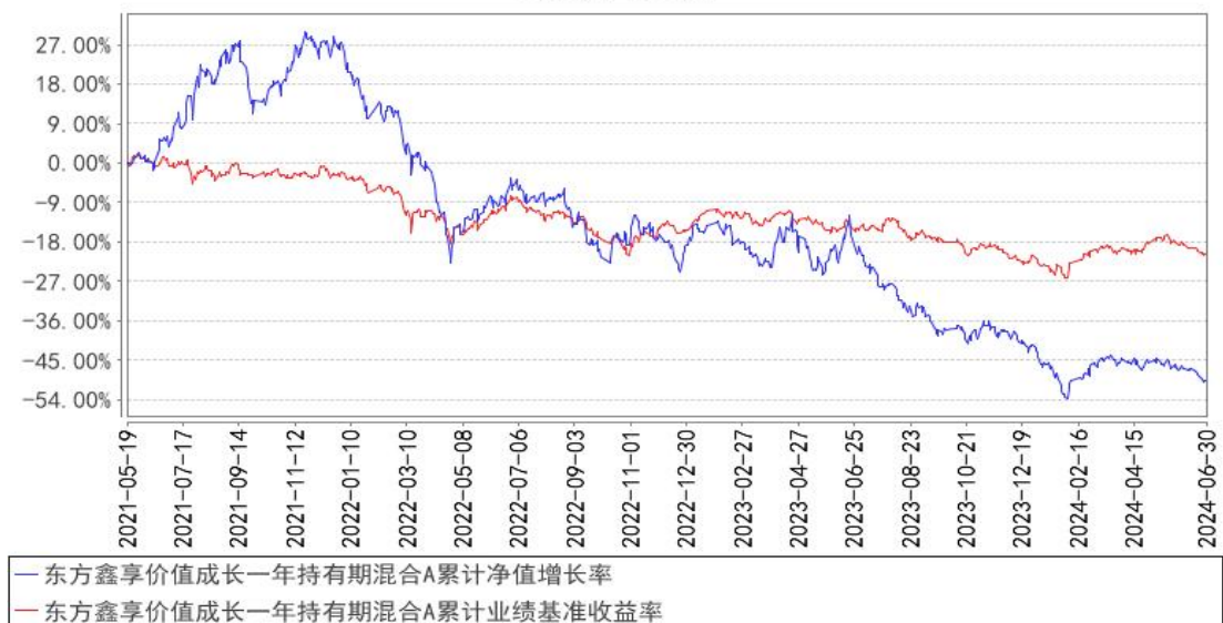
东方鑫享价值成长一年持有期混合A累计净值增长率与同期业绩比较基准收益率的历史走势对比图