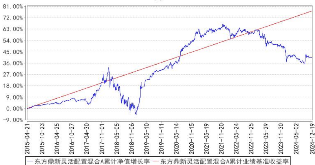
东方鼎新灵活配置混合A累计净值增长率与同期业绩比较基准收益率的历史走势对比图