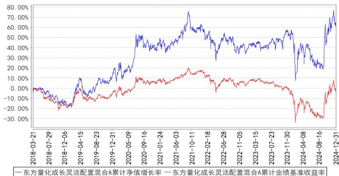
东方量化成长灵活配置混合A累计净值增长率与同期业绩比较基准收益率的历史走势对比图